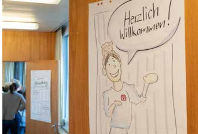
Gelebte Offenheit: Nicht nur am «Tag der Frau» sind Austausch und Vernetzung willkommen.

Ein besonderes Highlight im Herbst war das erstmals durchgeführte Krimi-Dinner. In verschiedenen Rollen schlüpfen die Teilnehmerinnen in eine fiktive Geschichte voller