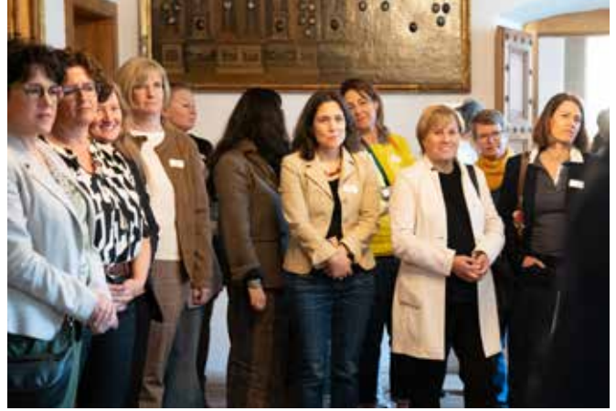
Das Schwyzer Politjahr wurde eingeläutet.

Im weiteren Jahresverlauf laden kreative und erlebnisorientierte Anlässe zur aktiven Teilnahme ein. Ein Töpferkurs in Altendorf spricht die Sinne an und bietet Raum für schöpferisches Arbeiten, während ein gemeinsames Escape-Spiel in Einsiedeln Teamgeist, Freude und Zusammenarbeit fördert. Nach der Sommerpause widmen wir uns gesundheitlichen