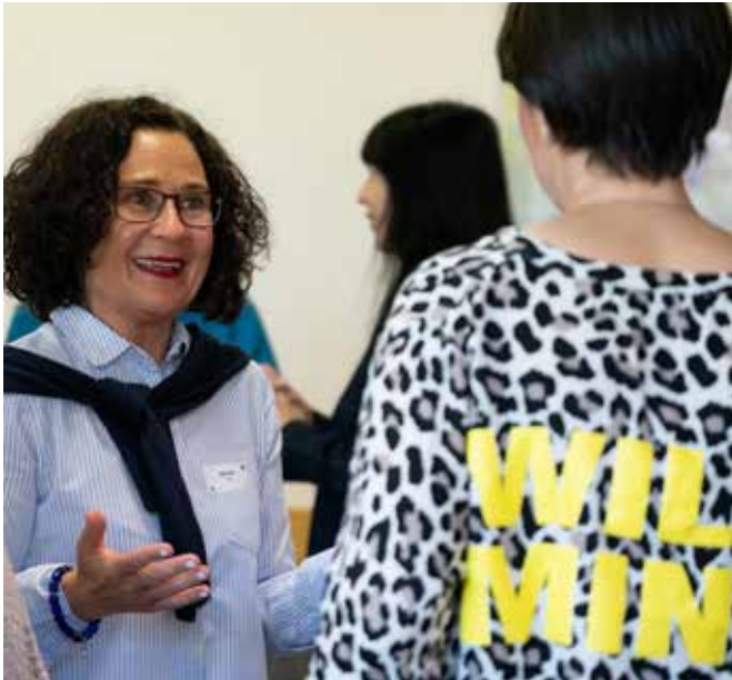
Jede Frau kann ihr Wissen einbringen.