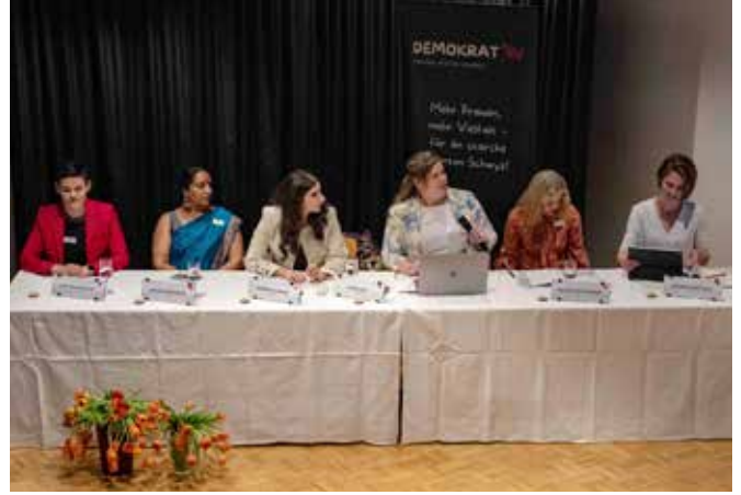
Ein engagierter Vorstand in Aktion.