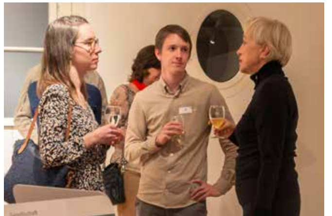
An der Vernissage des Quartetts waren auch Männer willkommen.