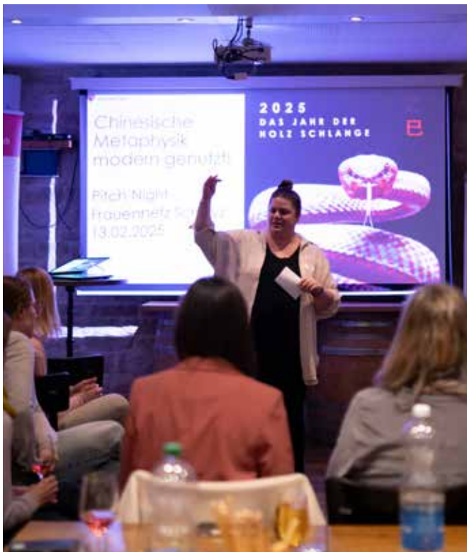
Erfolg auf Anhieb: Die Pitch Night war bereits bei der ersten Durchführung sehr beliebt.