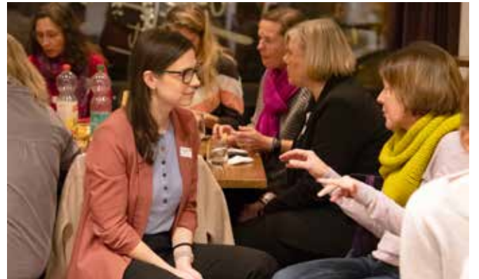
Austausch auf Augenhöhe: engagierte Frauen im Dialog.