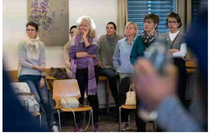
Relevante Inhalte: Was das frauennetz kanton schwyz organisierte, fand Interesse und Anklang.