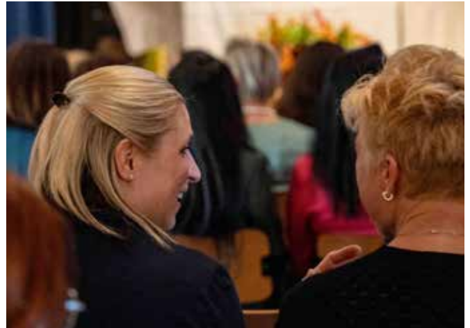
Gelebter Austausch an der Generalversammlung.