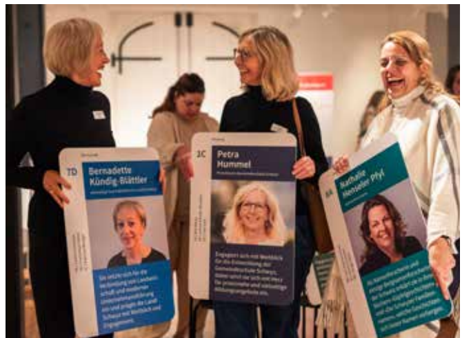
Premiere: Ein Quartett, das Frauen aus dem Kanton Schwyz und ihre Leistungen ehrt.